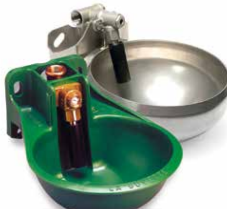
FORSTAL & F130 INOX